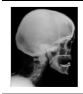
Abb. 1. Bei der Betrachtung des gesamten Knochens in dieser Röntgenaufnahme als eine visuell zusammenhängende Region, besitzt diese eine hohe Varianz im Grauwert. Die Kalotte ist wesentlich heller als der Kiefer abgebildet, so dass diese beiden Teilregionen eine große Abweichung bzgl. des mittleren Grauwertes besitzen, semantisch gehören sie jedoch zusammen.

beschrieben, die sich durch Mittelwertbildung über die Regionenpixel ergeben. Diese statischen Mittelwertsvektoren bilden die Parameter des Distanzmaßes. Sie sind nur dann repräsentativ für eine ganze Region, wenn die Varianz der Merkmalswerte innerhalb der Region gering ist. Fließende Verläufe von Merkmalswerten innerhalb visuell zusammenhängender Regionen - z.B. im Grauwert (Abb. 1) - führen jedoch zu einer hohen Varianz. Daher liefern statische Merkmale nicht immer relevante Segmente.